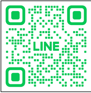
友だち登録用二次元コード