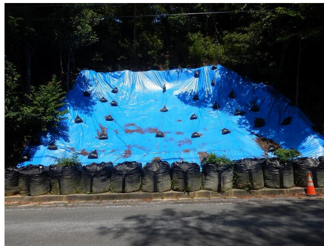
正面部 工事状況写真