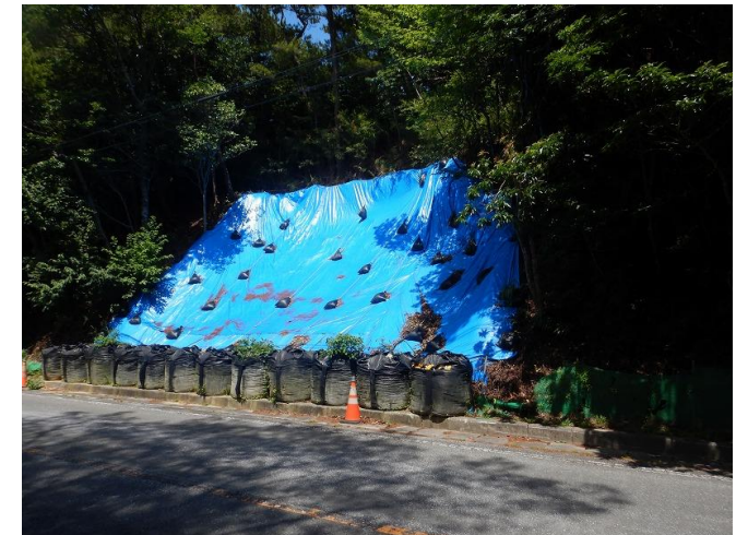
終点部 工事状況写真