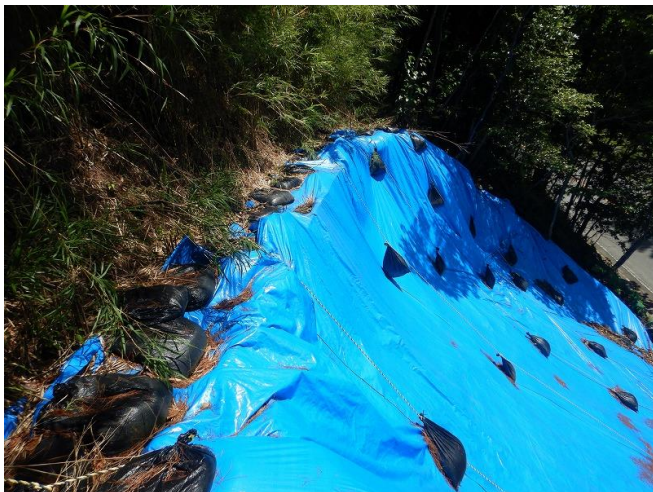
頭部 工事状況写真

復旧工施工状況写真 令和7年7月3日 工事進捗率:0% 主な作業:応急対策工維持管理