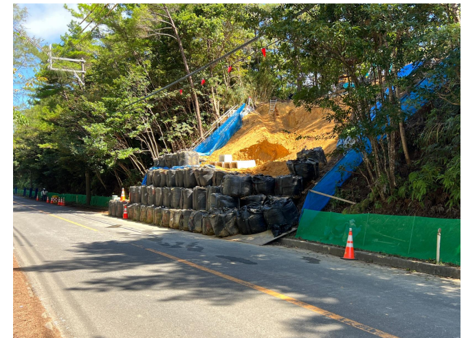
終点部 工事状況写真