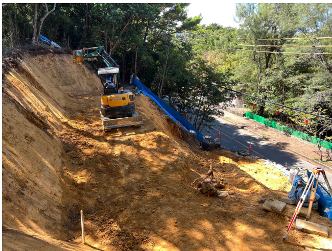
頭部 工事状況写真

復旧工施工状況写真 令和7年9月30日 工事進捗率:40% 主な作業:応急対策工維持管理