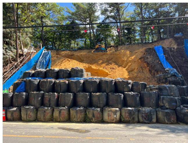
正面部 工事状況写真