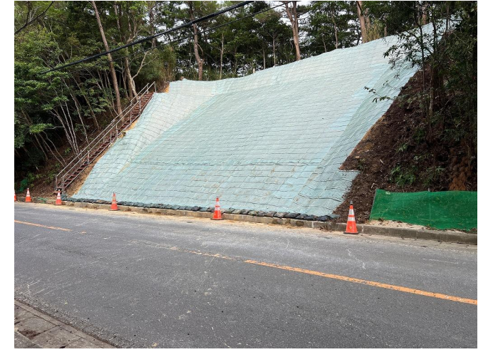
終点部 工事状況写真