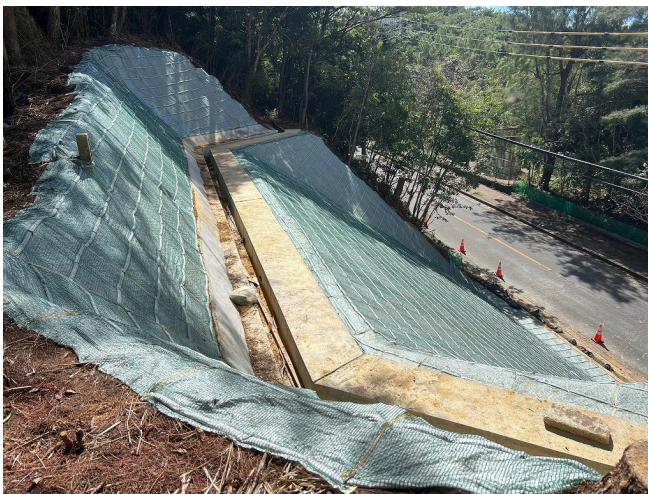
頭部 工事状況写真

復旧工施工状況写真 令和7年10月27日 工事進捗率:90% 主な作業:応急対策工維持管理