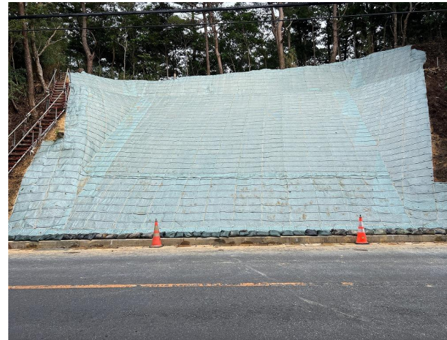
正面部 工事状況写真