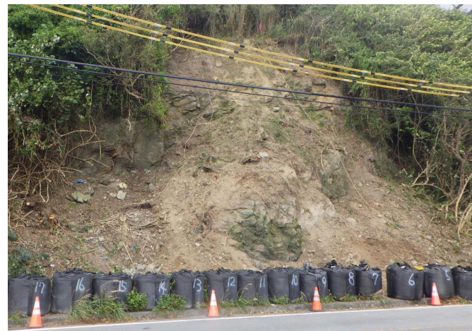
正面部 工事状況写真