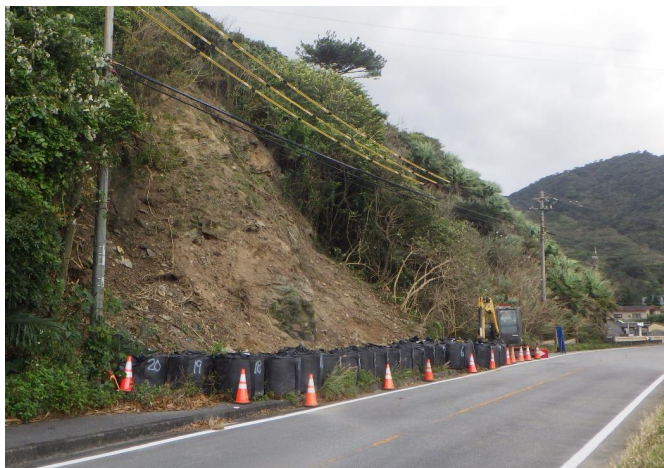
起点部 工事状況写真

復旧工施工状況写真 令和8年1月13日 工事進捗率: 10% 主な作業: 応急対策工維持管理