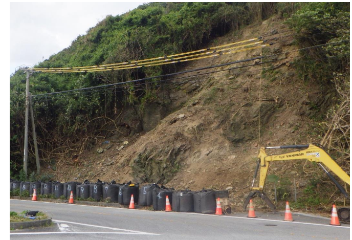
終点部 工事状況写真