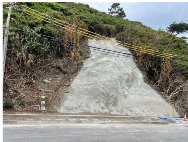
正面部 工事状況写真