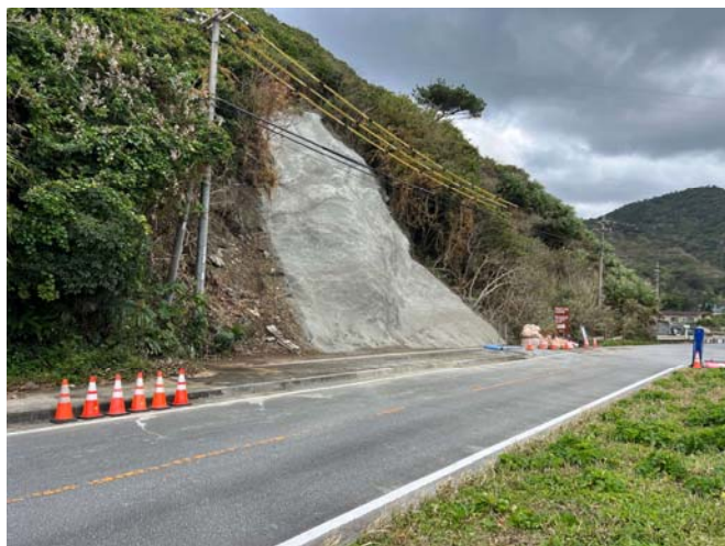
起点部 工事状況写真

復旧工施工状況写真 令和8年1月29日 工事進捗率:90% 主な作業:応急対策工維持管理