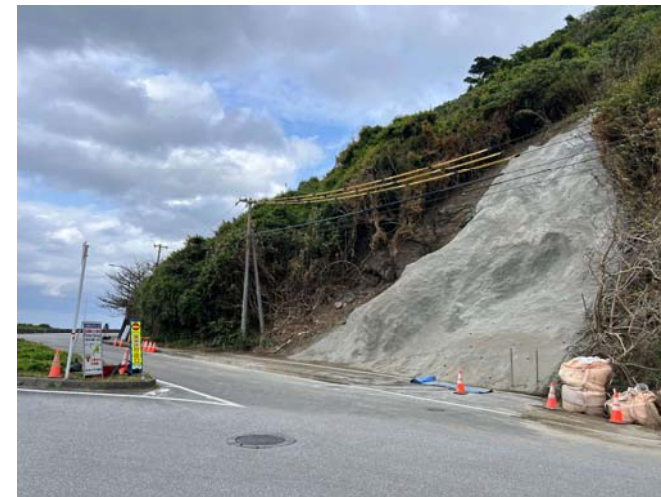
終点部 工事状況写真