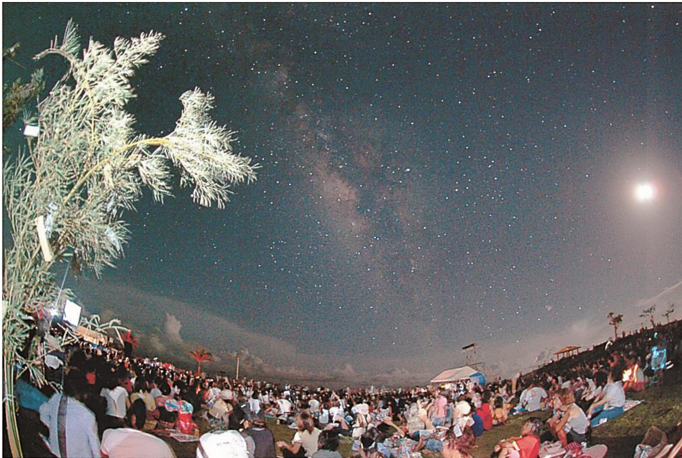
南の島の星まつり①