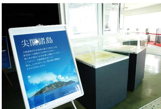
石垣市尖閣諸島情報開発センター(2F)