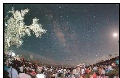
南の島の星まつり