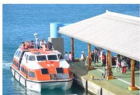
クルーズ客上陸の様子

みなとオアシスいしがきの代表施設「ユーグレナ石垣港離島ターミナル」は、竹富島、西表島、小浜島、黒島など八重山の離島航路の拠点となっており、観光客だけでなく地元住民の生活やビジネスの拠点として年間約200万人が利用しています。また、大型クルーズ船寄港時はテンドーポートでの上陸箇所としても活用されており、八重山圏域を訪れる国内外の観光客の殆どが利用する一大拠点となっています。