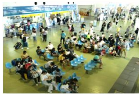
離島ターミナルの利用状況