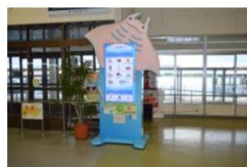
多言語化観光案内版