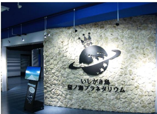
いしがき島星ノ海プラネタリウム