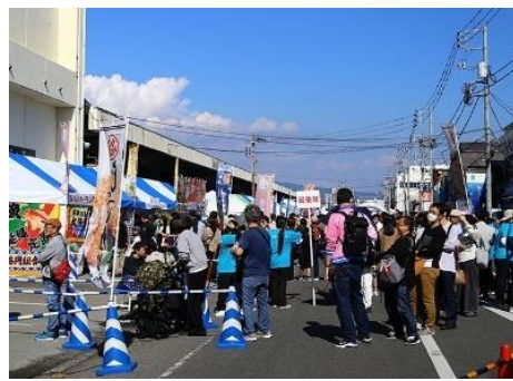
地域振興イベントの開催状況 (Sea級グルメ全国大会in沼津)