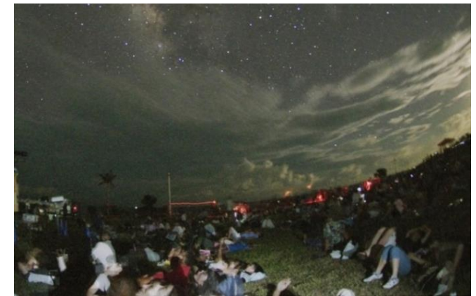
南の島の星まつり②