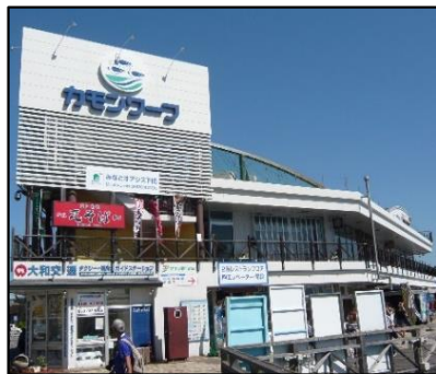
構成施設のイメージ (下関港、カモンワーク)