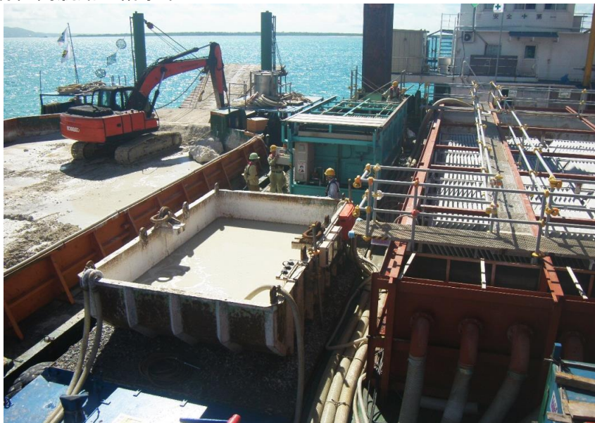
濁水濾過処理状況