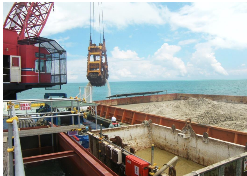
土砂台船積み込み状況