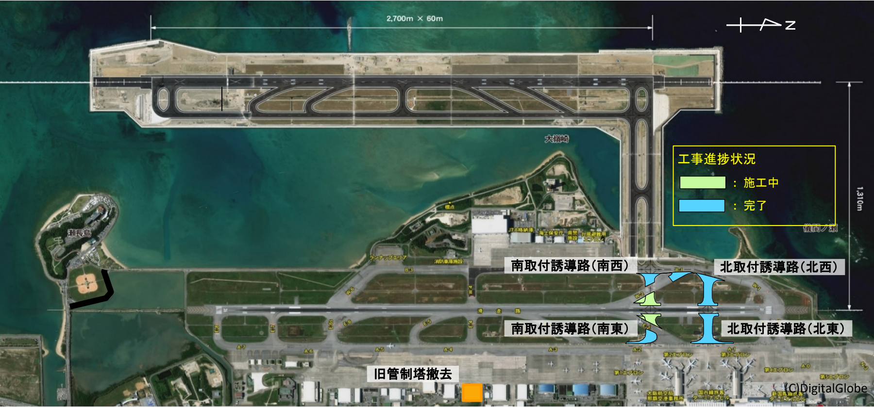
図1 各工事の進捗状況