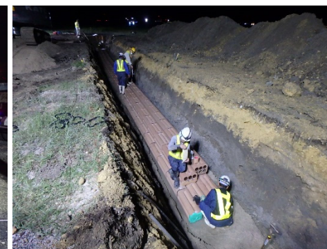
③ 南取付誘導路 南西 ケーブルダクト配置状況 (令和2年6月撮影)