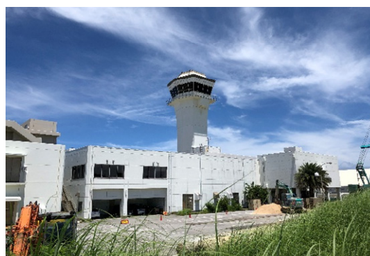
① 旧管制塔状況（機器等撤去中） （令和2年6月撮影）