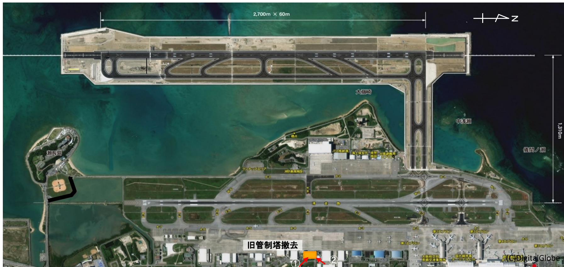
図3 その他空港施設工事等の実施位置