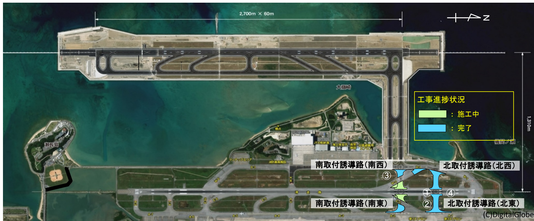
図2 舗装工事の実施位置