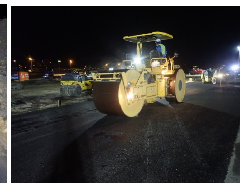
④ 北取付誘導路 北東 滑走路ショルダー舗装状況 (令和2年6月撮影)