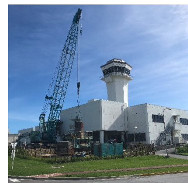
② 旧管制塔状況（機器等撤去中） （令和2年6月撮影）