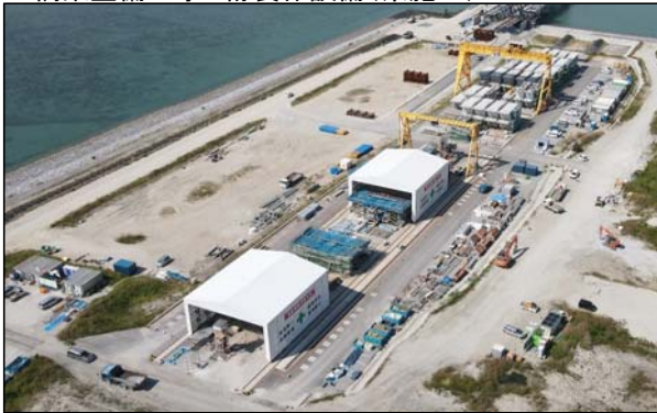
■ 橋梁整備工事 桁製作設備(県施工)