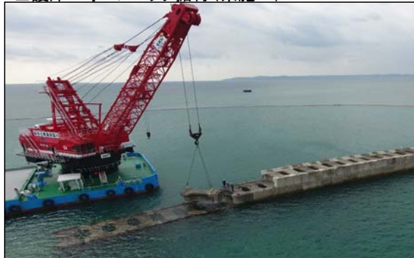
■ 護岸工事 ブロック据付(県施工)