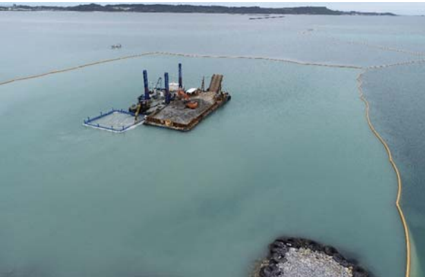
■汚濁防止膜設置 い護岸 (国施工)