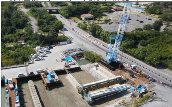
■ 橋梁整備工事 上部工架設状況(県施工)