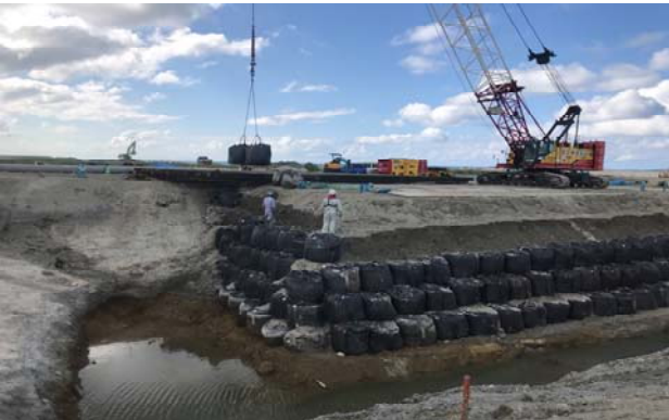
■余水吐大型土のう設置(国施工)