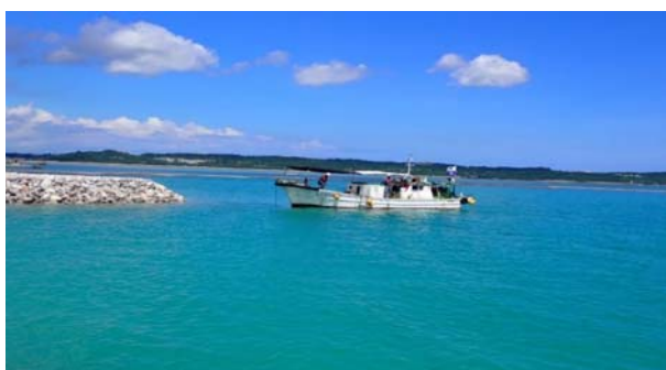
■護岸工事 捨石均し(国施工)