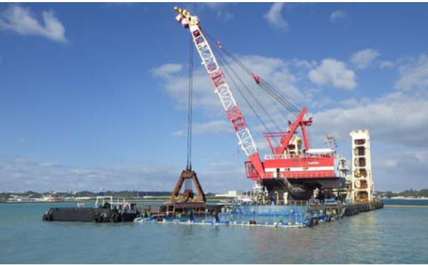
■汚濁防止枠の使用 浚渫(国施工)