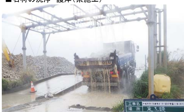
■石材の洗浄 護岸(県施工)