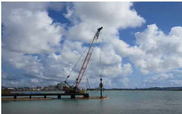
■仮設橋梁撤去工事 H鋼杭引抜き(国施工)