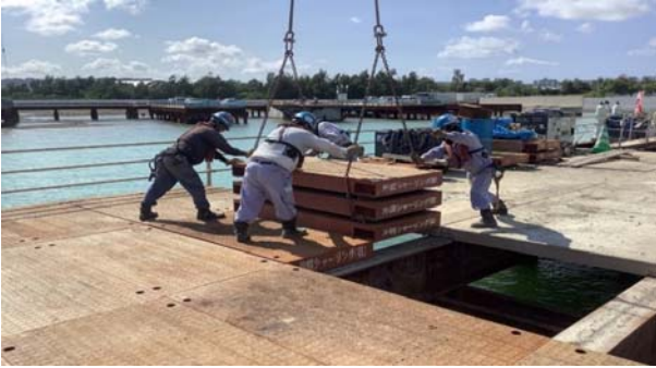
■仮設橋梁撤去工事 鋼製覆工板設置(国施工)