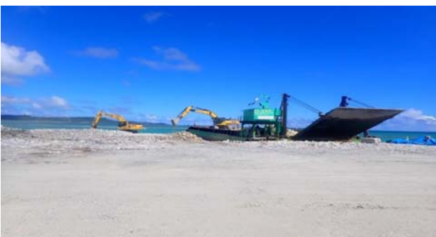
■護岸工事 石材投入(国施工)