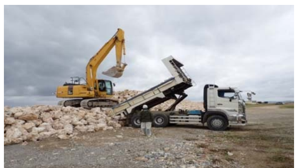
■護岸工事 築堤築造(国施工)