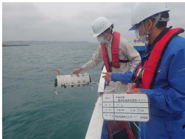
■工事箇所の濁り監視 海上 (国施工)