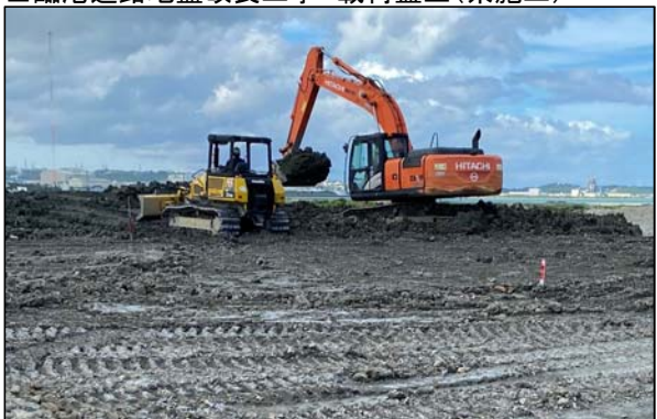
■ 臨港道路地盤改良工事 載荷盛土(県施工)