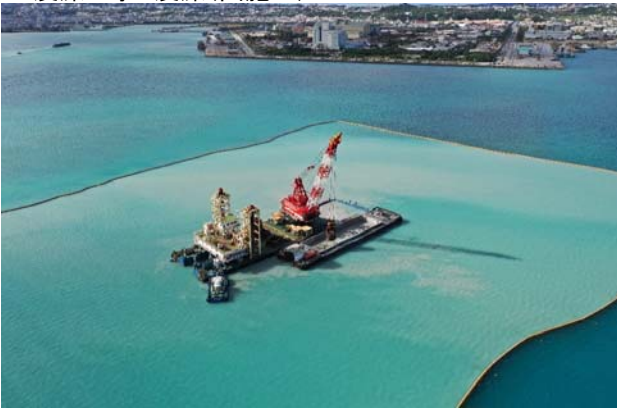
■浚渫工事 浚渫(国施工)