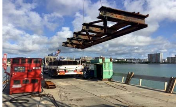
■仮設橋梁撤去工事 上部撤去(国施工)