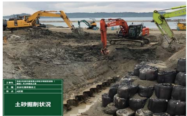
■余水吐土砂掘削(国施工)