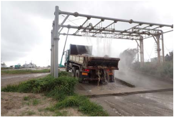
■石材の洗浄 い護岸 (国施工)