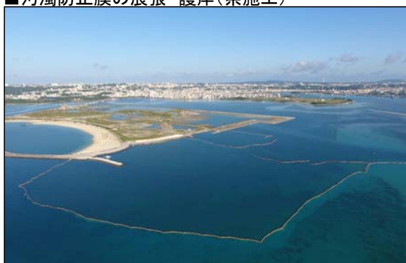
■汚濁防止膜の展張 護岸(県施工)