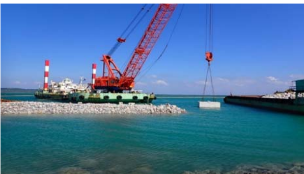
■護岸工事 ブロック据付(国施工)