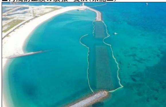
■汚濁防止膜の展張 養浜(県施工)