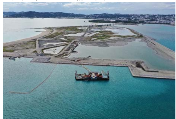
■浚渫工事 空気圧送揚土(国施工)