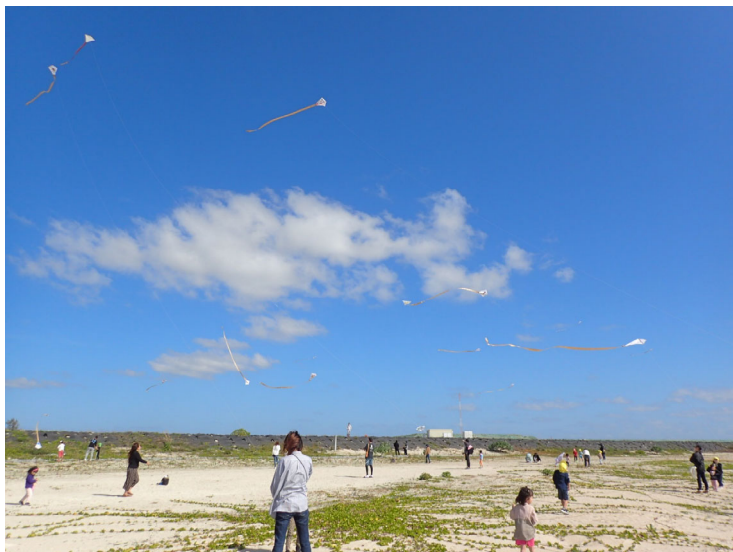
人工島での凧揚げの様子