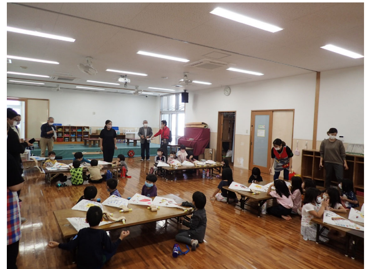
参加者による凧づくりの様子