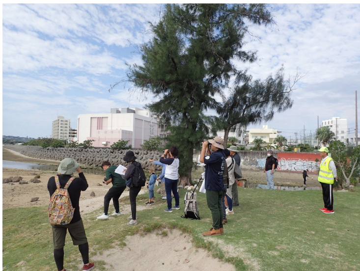
野鳥観察会 前之浜