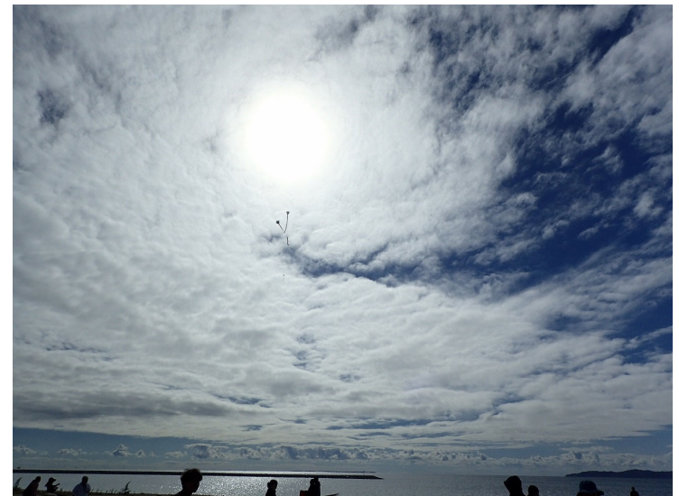
人工島での凧揚げの様子