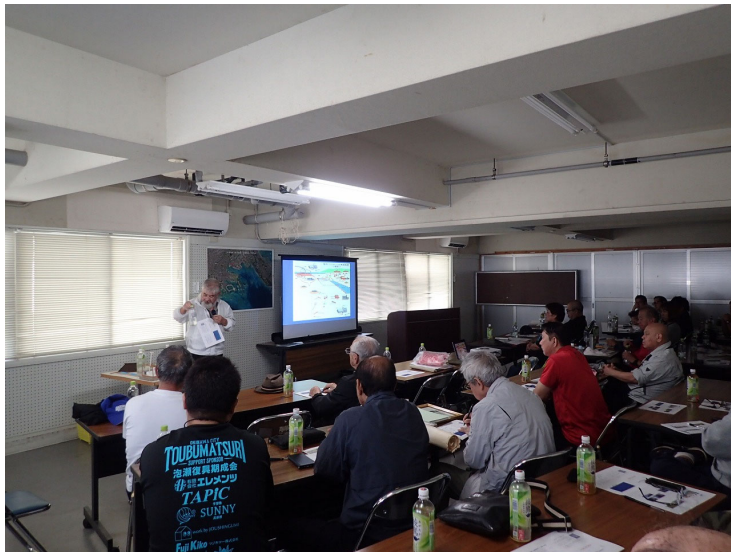
地域の歴史と塩づくりの説明