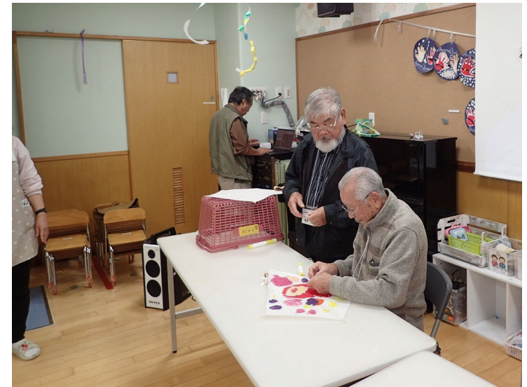
講師による凧作りの手ほどき