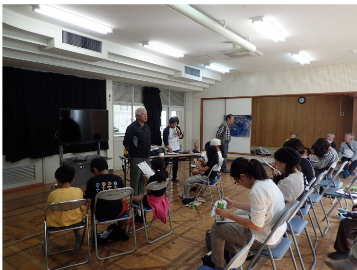
メモしたワークシートで当日観察した野鳥の種類を確認