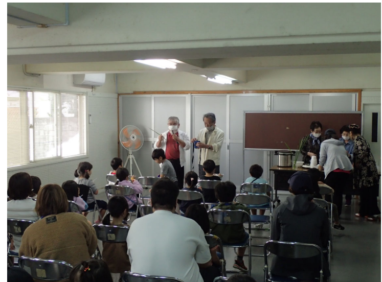
泡瀬老人会による甘菓子の提供