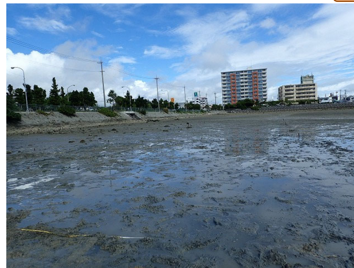
底質改良作業実施後