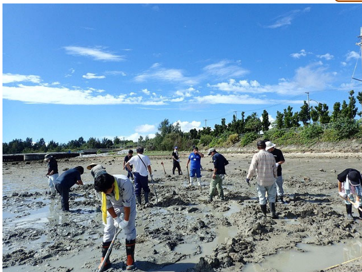
底質改良作業の様子