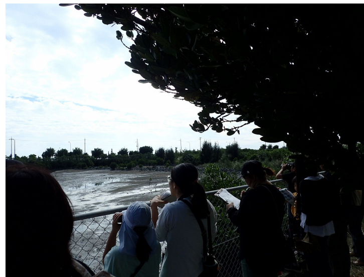
野鳥観察会 比屋根湿地