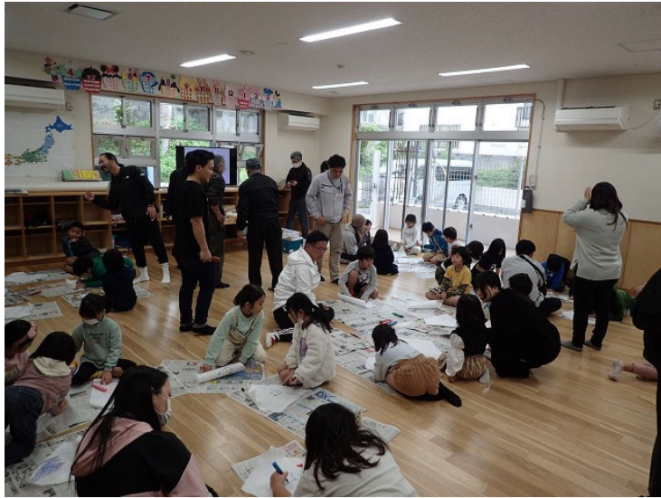
参加者による凧づくりの様子