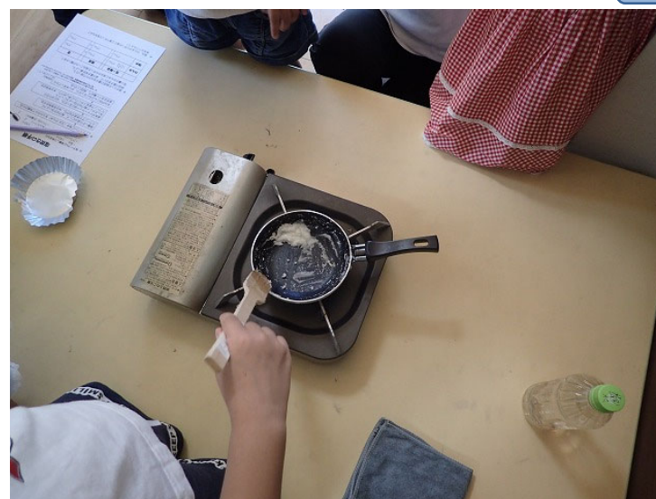
参加者による塩づくりの様子