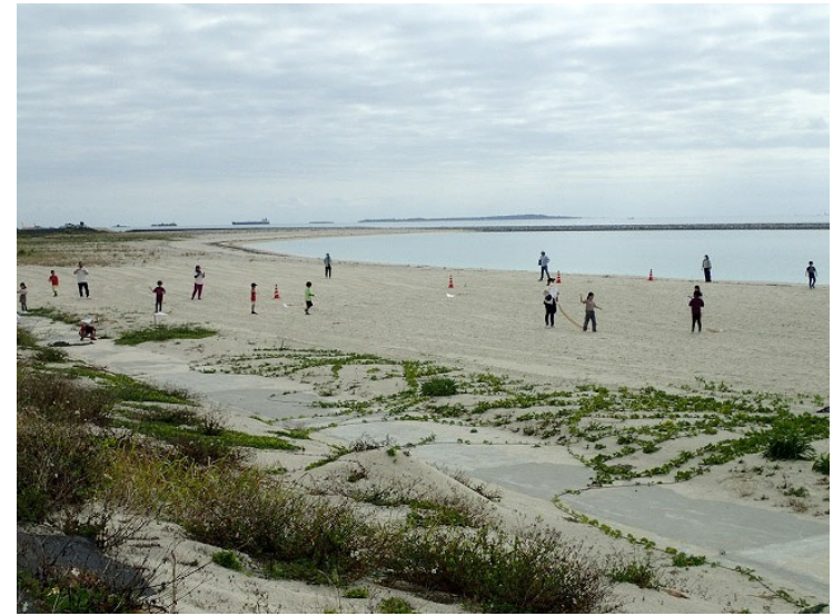
人工島での凧揚げの様子