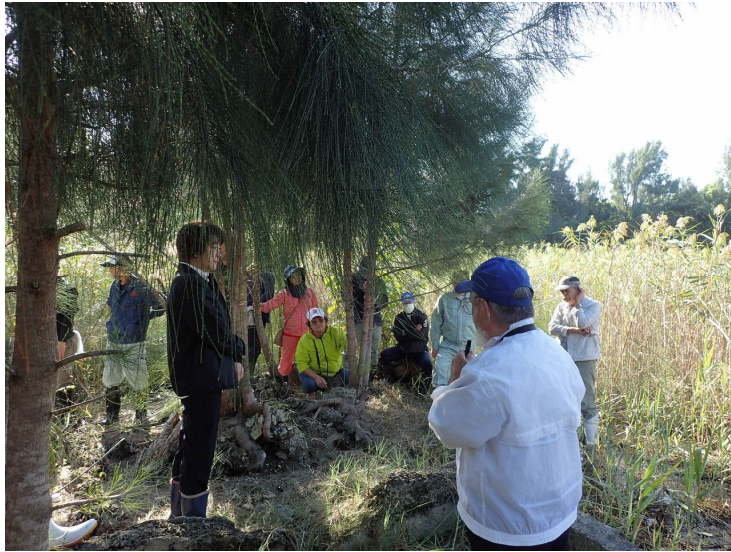
塩田跡地のクミ跡視察