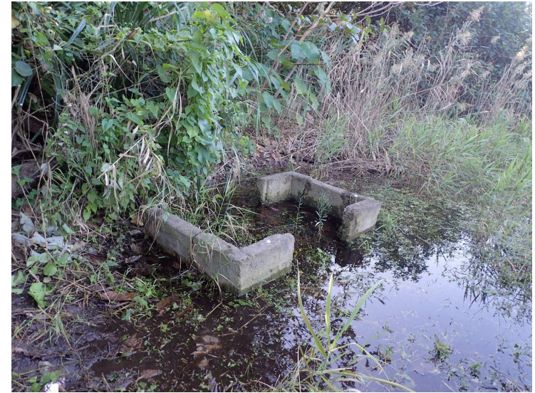
塩田跡地のクミ跡視察