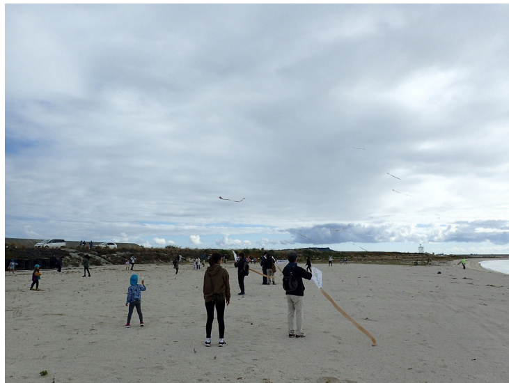
人工島での凧揚げの様子