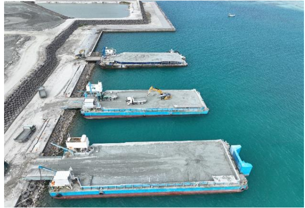
浚渫工事 浚渫(国施工)