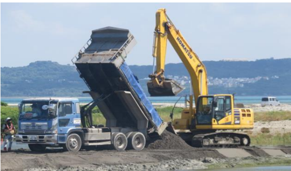
場内整備工事 海砂投入均し(国施工)