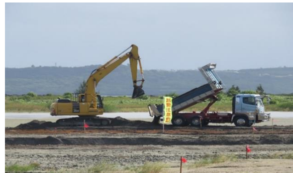
場内整備工事 海砂投入均し(国施工)