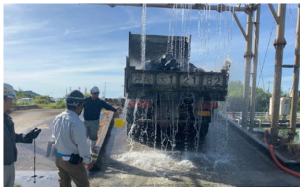
石材の洗浄 護岸工事(県施工)