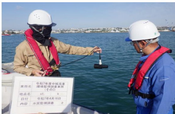
工事箇所の濁り監視 海上(国施工)