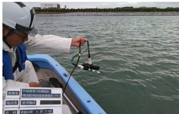
工事箇所の濁り監視 海上(県施工)