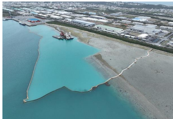
汚濁防止膜展張 浚渫(国施工)