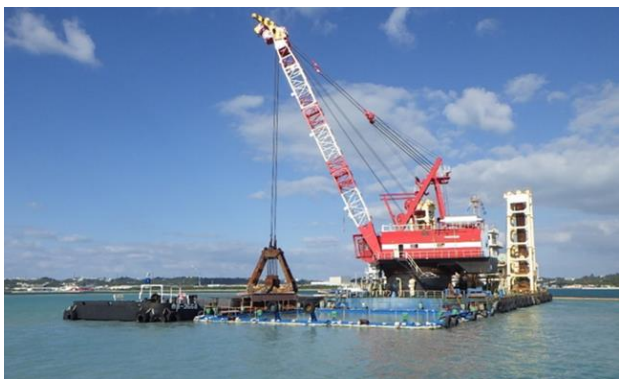
汚濁防止枠の使用 浚渫(国施工)