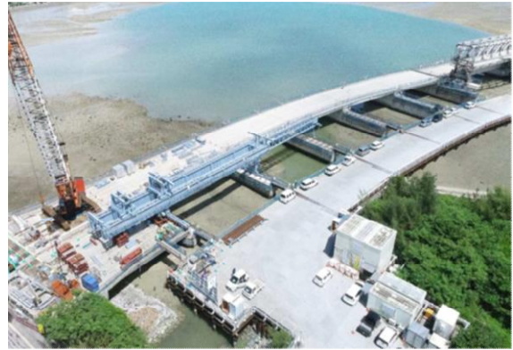
橋梁整備工事 上部工架設(県施工)