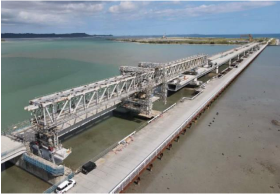
橋梁整備工事 上部工架設(県施工)