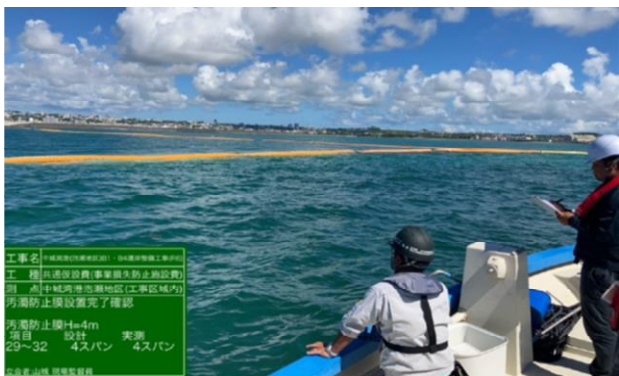
汚濁防止膜 護岸工事(県施工)