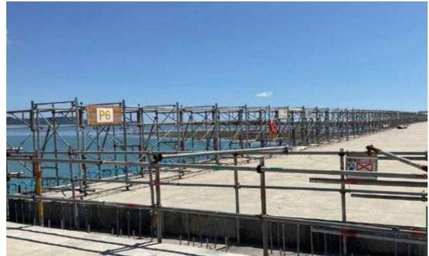
橋梁整備工事 橋面工(県施工)