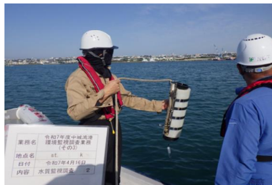
工事箇所の濁り監視 海上(国施工)