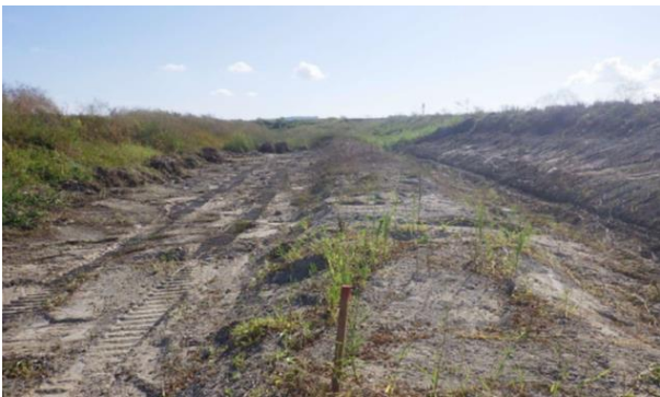
道路改良工事 臨港道路(県施工)