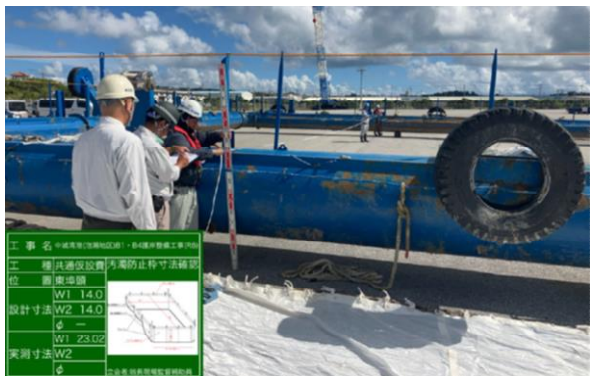
汚濁防止枠 護岸工事(県施工)