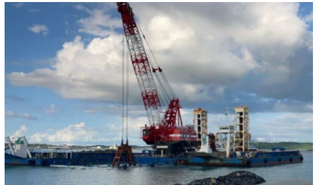
護岸工事 床掘(県施工)