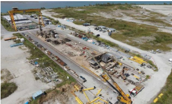
橋梁整備工事 桁製作設備解体(県施工)