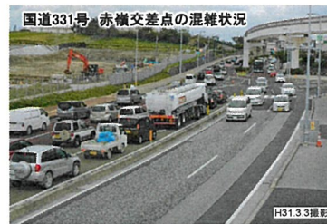
国道331号 赤橋交差点の混雑状況