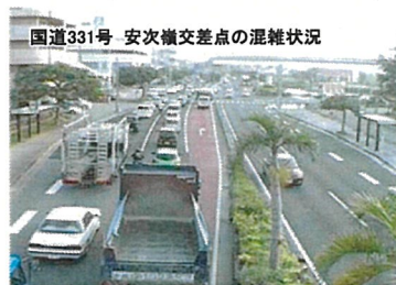
国道331号 安次橋交差点の混雑状況