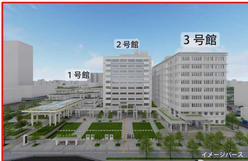
イメージパース図