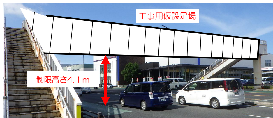
交通規制 (高さ制限) 概要図

https://maps.gsi.go.jp/#17/26.263930/127.714820/&base=std&ls=std&disp=1&vs=c1g1j0h0k0l0u0t0z0r0s0m0f0