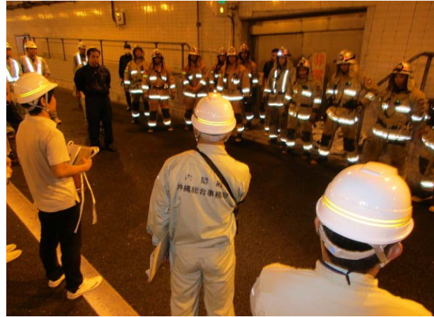
訓練実施後のミーティング