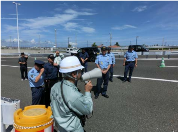
開始前のミーティング