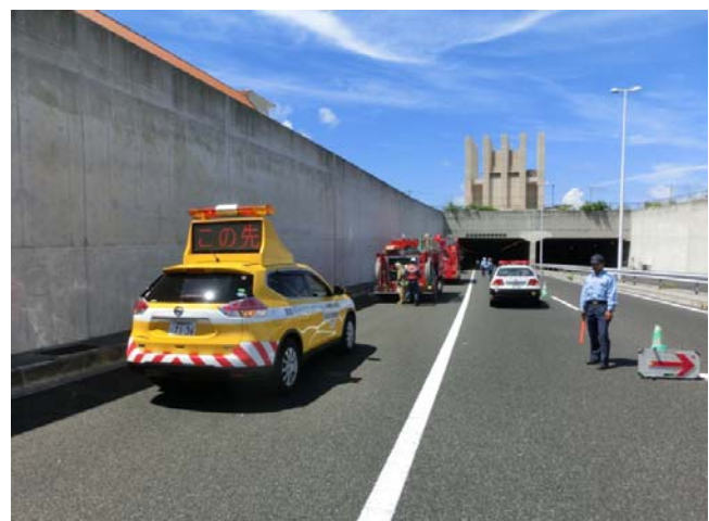
通行規制(確認)状況