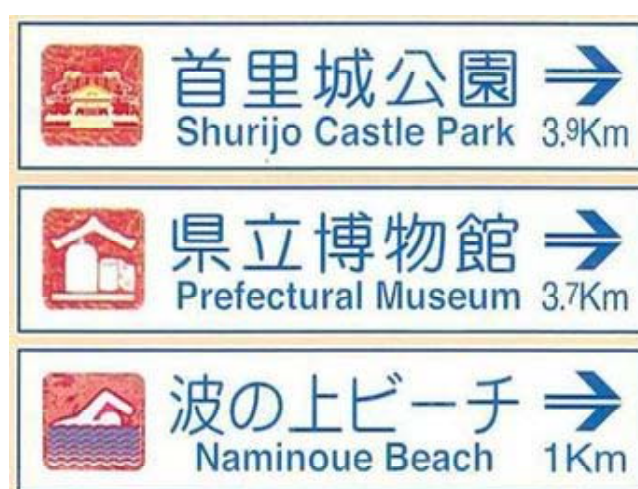
英語表記（ローマ字）の例

また、現場（現地）の道路案内標識で修正可能な標識については、年度内から修正を行うこととしています。