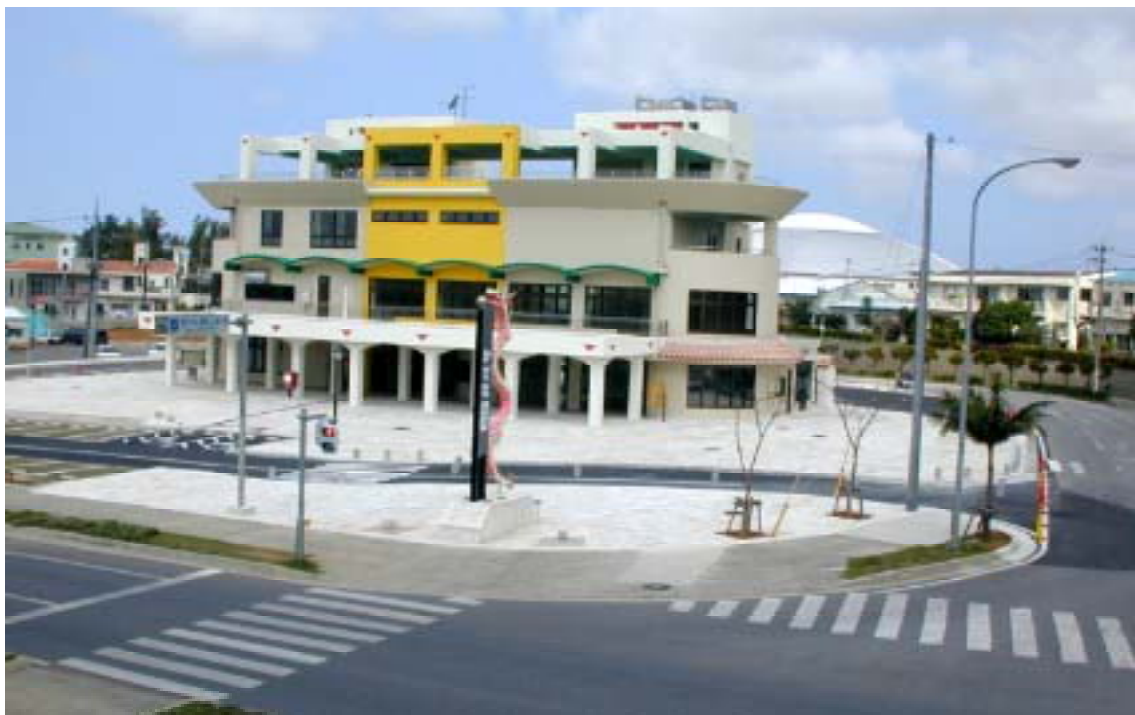
道の駅「かでな」外観