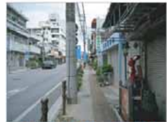
【那覇北中城線 那覇市】