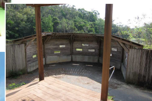
野鳥観察小屋(漢那ダム)