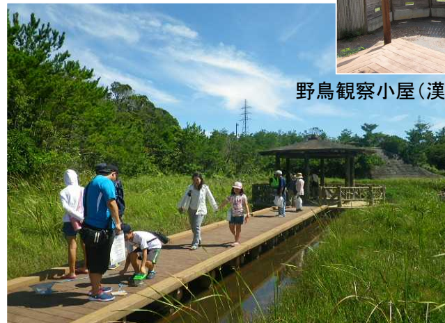
漢那ダムで創出した湿地環境での学習会