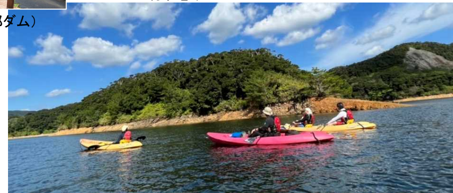
ダム湖でのカヌー体験ツアー