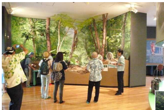
ダム資料館のジオラマ(羽地ダム)