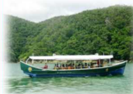
福地ダム自然観察船