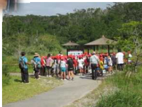
ダム資料館の見学