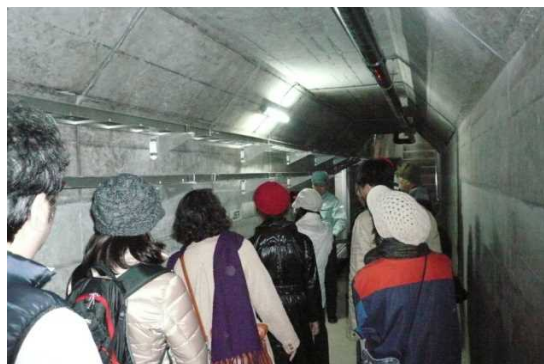
ダム内部(監査廊)の見学状況(漢那ダム)

※ ①、⑧は事前に調整した団体客のみに限定しています。②、⑥、⑦は地元団体が実施するツアーがあります。