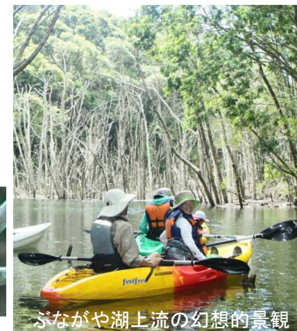
ぶながや湖上流の幻想的景観