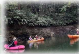
安波ダムカヌー体験