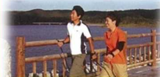
大保ダムでのノルディックウオーキング