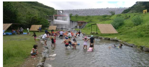
羽地ダムでの川遊び