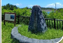
お茶の発祥地石碑 (展望台)